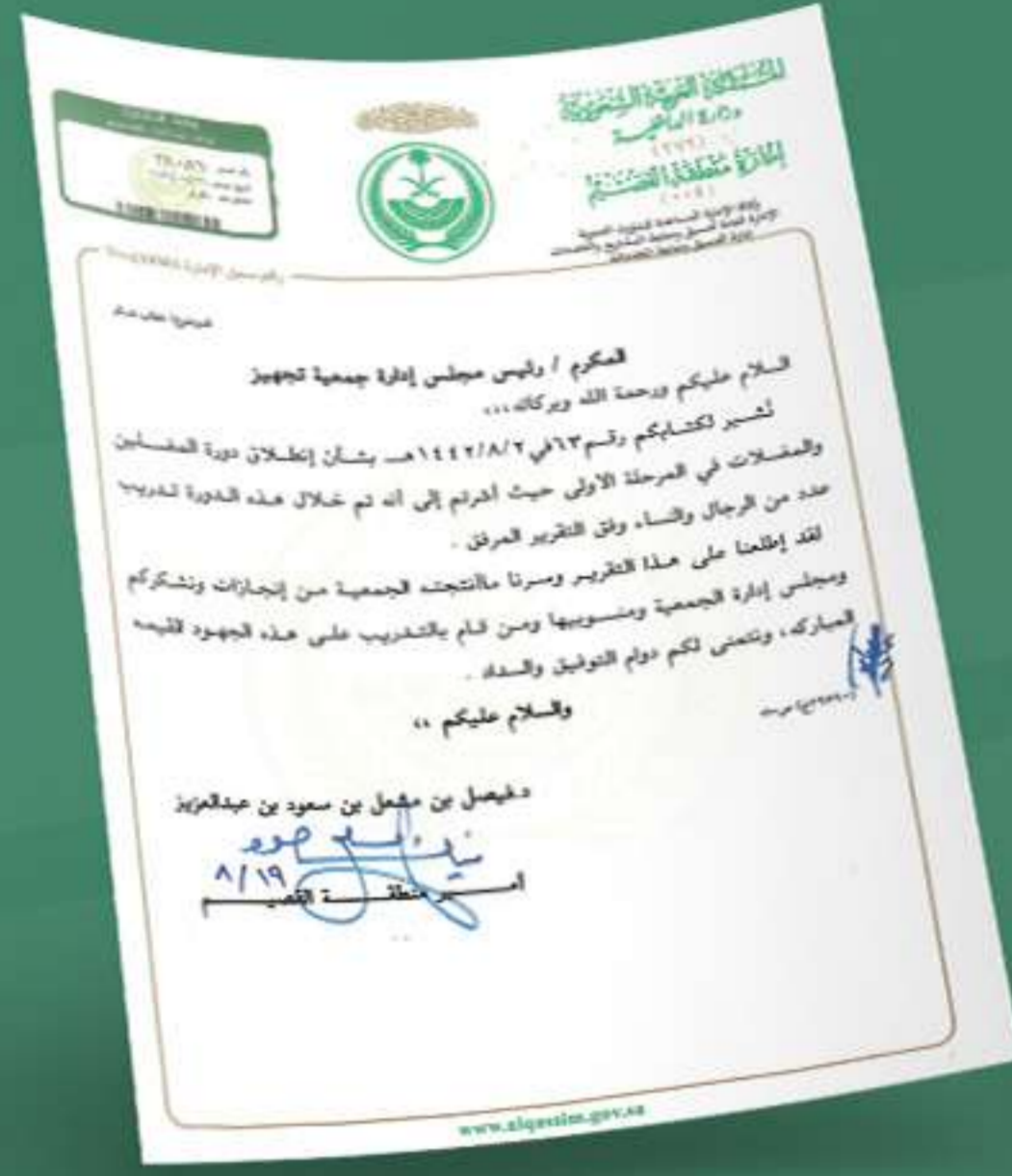
خطاب شكر ومباركة