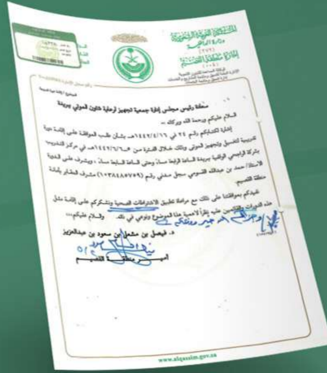
خطاب موافقة على إقامة الدورة